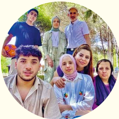
Familie S. aus Afghanistan konnte dank unserer Unterstützung vereint werden.

Ein grosser Teil unserer Arbeit wird durch Spenden finanziert. Sie ermöglichen eine individuelle Begleitung, den Einsatz für das Recht auf Familie und tragen dazu bei, dass Familiennachzug nicht an bürokratischen Hürden scheitert.